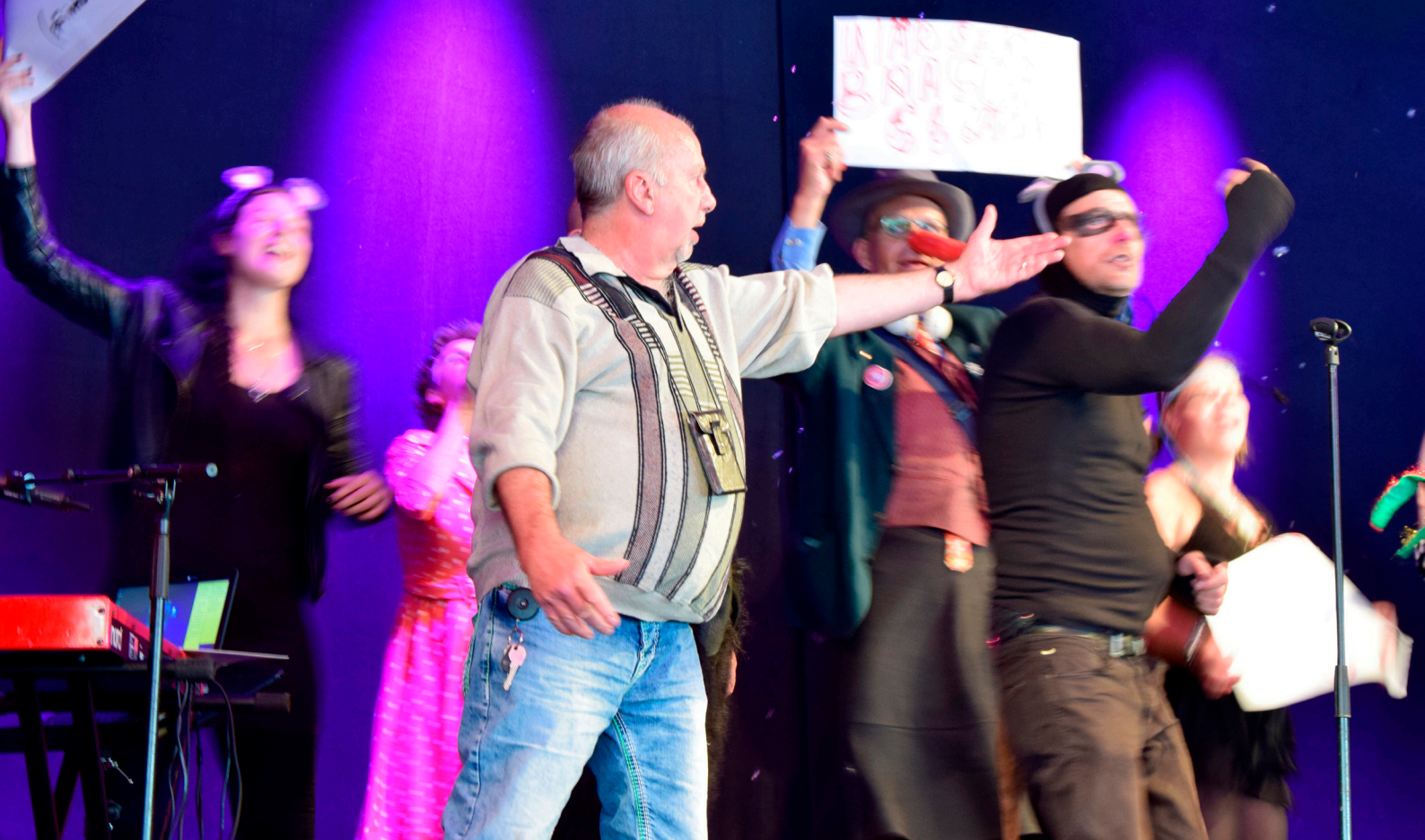
Bosse är med i RÖST som är Göteborgs Stadsmissions teaterprojekt. Här från en föreställning under Göteborgs Kulturkalas.

– Med drogerna kunde jag stänga av och slippa tänka och känna, säger han.